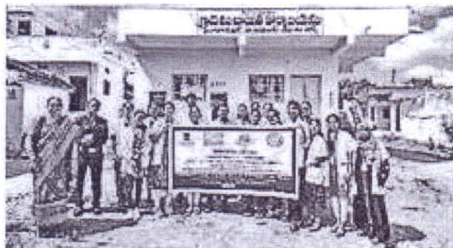
ర్యాలీ నిర్వహిస్తున్న అధ్యాపకులు, విద్యార్థులు