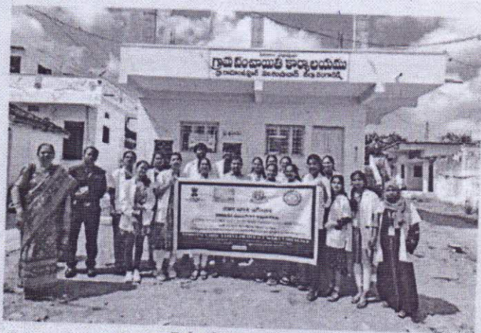
రామంజుపూర్ లో సర్వే నిర్వహిస్తున్న కేంద్ర బృందం