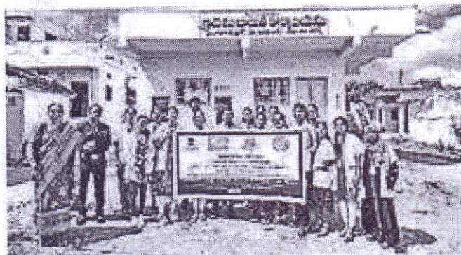
ర్యాలీ నిర్వహిస్తున్న అధ్యాపకులు, విద్యార్థులు

శంషాబాద్, న్యూస్ టుడే: ఉన్నత్ భారత్ అభియాన్ పథకంలో భాగంగా సరోజిని నాయుడు పనితాపార్వసీ మహా విద్యాలయ కళాశాల అధ్యాపకులు, విద్యార్థులు సోమవారం శంషాబాద్ మండలం రామాంజిపూర్లో సర్వే